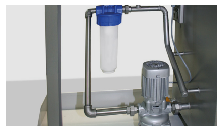
Pompe et filtre