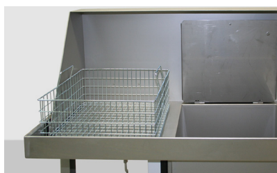
Panier de nettoyage en train d'égoutter